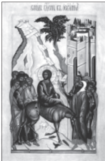
Вход Господень в Иерусалим. Современная икона.

Еще один двенадцатый праздник — Церковь вспоминает торжественный вход Господа Иисуса Христа в Иерусалим, ставший предвестием Его грядущих страданий. Все жители столицы вышли встречать Иисуса Христа. Они ликовали, постилали на пути Господа свои одежды и пальмовые ветви (ваия) и восклицали: «Осанна (спасение) Сыну Давидову! Благословен Грядый во имя Господне!». Через несколько дней эти же люди будут кричать Пилату: «Распи Его...».