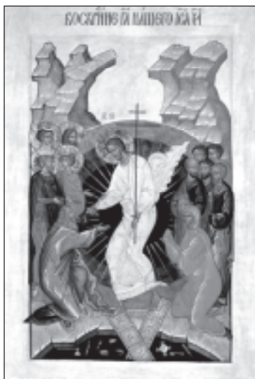
Сошествие во ад. Современная икона.

Великая Суббота ( 14 апреля ) — время пребывания Тела Господня во гробе. А душою Своєю Господь в этот день сошел во ад, где, ожидая спасения мира, томилась душа всех умерших до этого времени людей, даже ветхозаветных праведников.