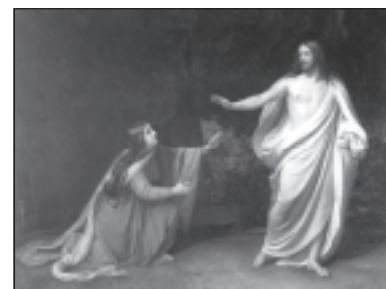
А.А.Иванов. Явление Христа Марии Магдалине.